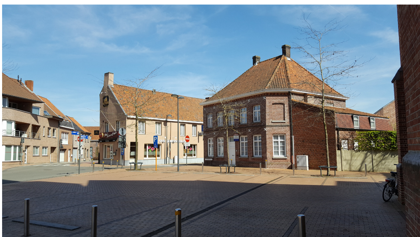
Den Arend anno 2018