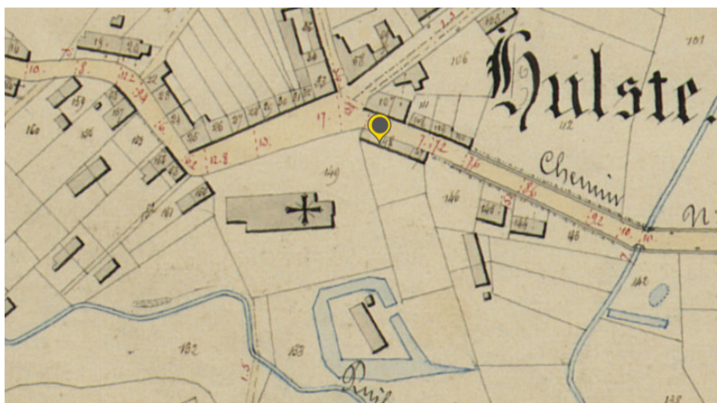
Fragment uit de Atlas der Buurtwegen 1841. Onderaan de Hazebeek en de oude - nog omwalde - pastorie. Centraal de oude kerk en de huizen (met merktekentje) waar later Den Arend kwam die hier nog naar de Vlietestraat gericht waren.