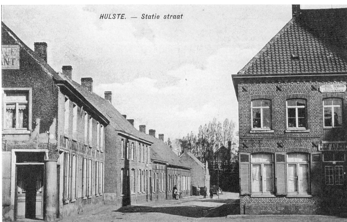
Twee ongedateerde prentbriefkaarten met zicht op de Statiestraat (nu de Vlietestraat) met rechts Café Den Arend en links café Het Oud Gemeentehuis